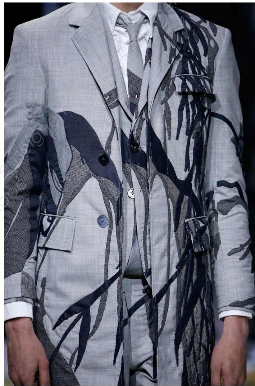
SÉRIE B, - Document 2 – Thom BROWNE, collection prêt à porter homme, printemps-été 2016.