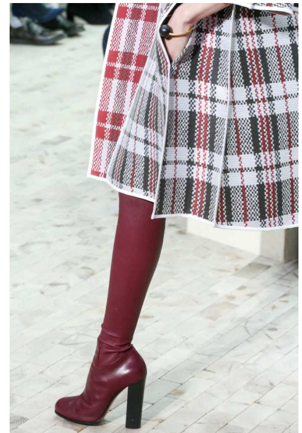
SÉRIE A- Document 1 – CÉLINE, manteau en jacquard de soie double face, collection automne-hiver 2013.